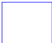
Plan élargi de Labastide Saint Pierre

Cliquer sur la vignette pour visualiser le plan.