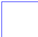
Plan du lotissement Saint-Pierre